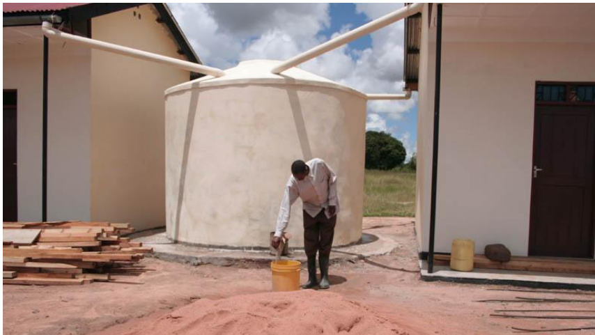
Einer der Regenwassertanks