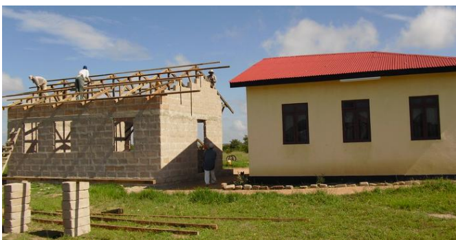
2010, Bau des Mädchenschlafraum

Mit dem Bau des Heimes für Straßenkinder und Waisen wurde 2006 begonnen. Die Stadt Sinigida hat dafür ein angemessenes Areal zur Verfügung gestellt. Auf dem Grundstück ist Platz genug, um neben baulichen Einrichtungen den Anbau von Gemüse und Getreide zu ermöglichen und bietet Platz für die Haltung von Nutzvieh. Erste Maßnahme war die Einzäunung des Geländes. Bis zur Eröffnung im Mai 2008 wurden Schlafräume, Sanitäreinrichtungen, Küche etc. für eine Belegung von 10 bis 15 Kindern, zu Anfang nur Buben, errichtet.