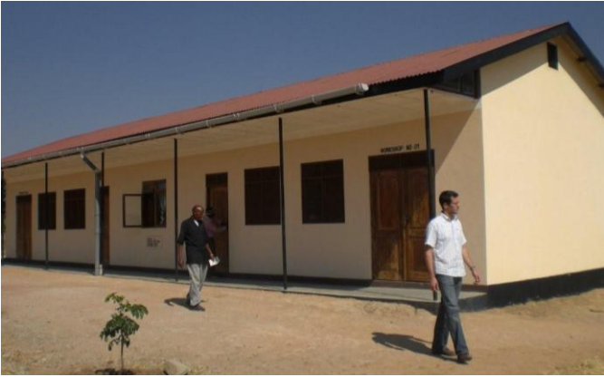
2009 wurden die Werkstätten fertiggestellt.